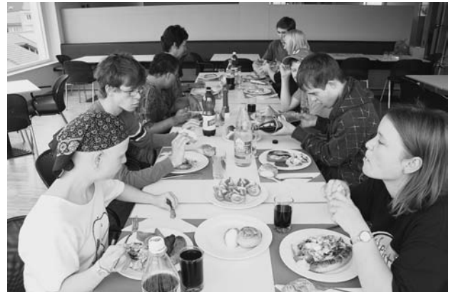
Hitverdächtig: Der selbstgebackene Sonntagszopf und das gemeinsam zubereitete Mittagessen fördern den Teamgeist