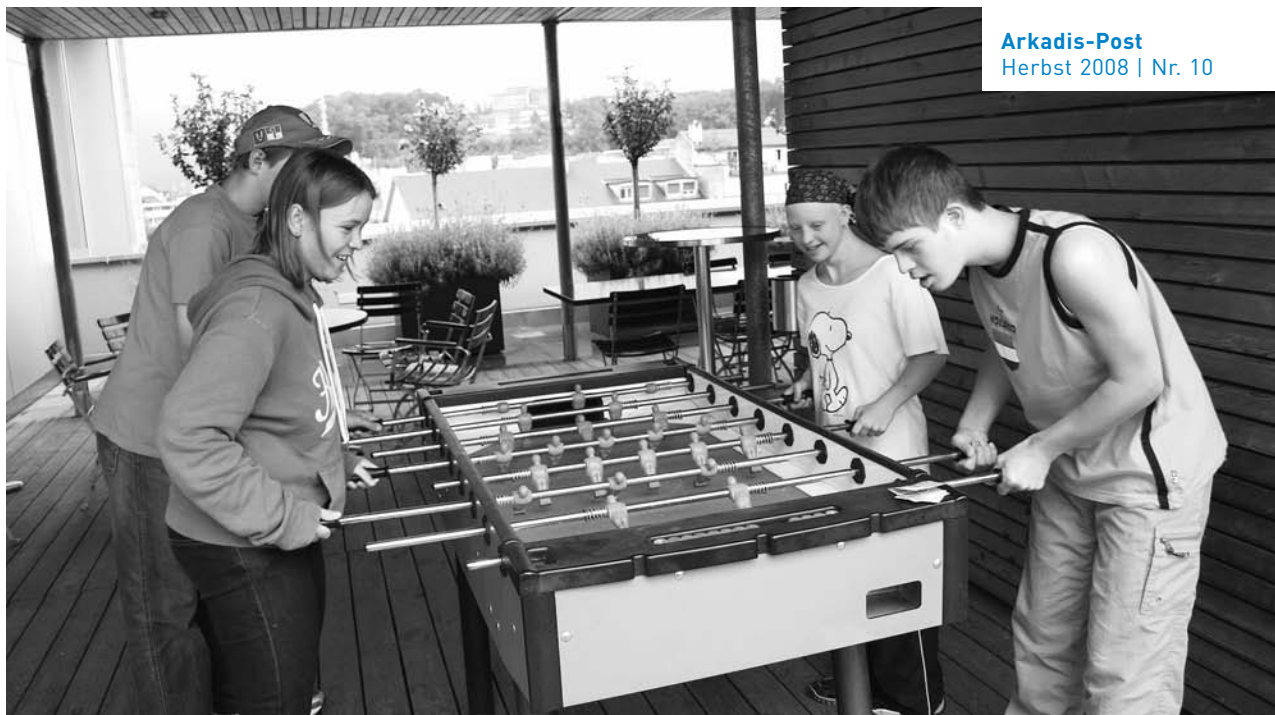
Arkadis-Post Herbst 2008 | Nr. 10

Freizeit gemeinsam gestalten: Der neu gestartete Treffpunkt im Arkadis-Zentrum wird von den Jugendlichen rege genutzt